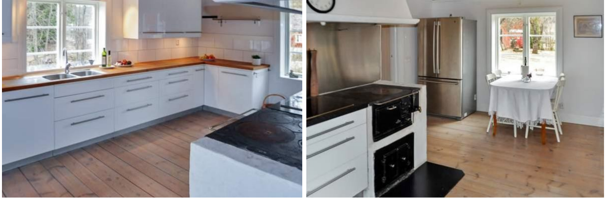
1 grosse Küche (für beide Gruppen)