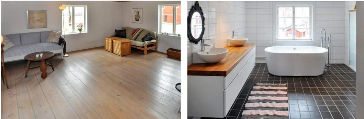
1 grosser Wohnraum und das Bad